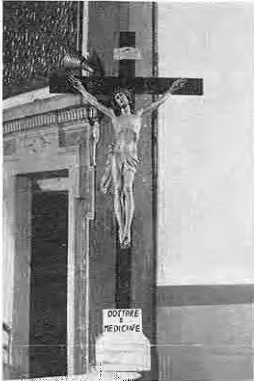
Il vero Dottore