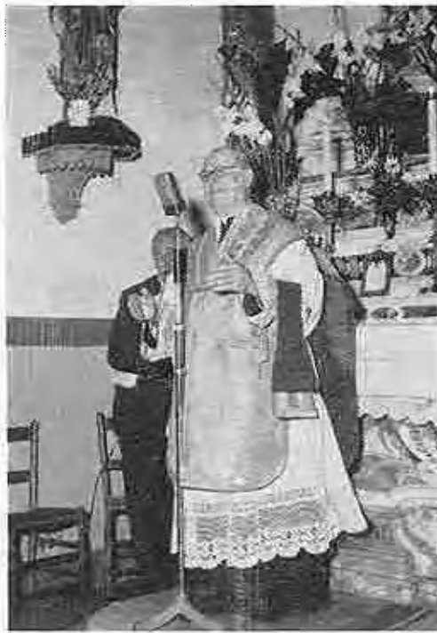
P. Lampedosa annuncia un pranzo

Intanto un pesante odore di panni sporchi, bagnati di sudore, di suole marcie ammorbava l'aria, ma nessuno di noi se ne accorgeva, mentre il Padre raggianti passava dall'uno all'altro. Non ricordo a che ora uscimmo di là, certo molto tardi. Il giorno seguente sotto la pioggia sempre insistente grosse scarpe militari si aggiravano qua e là per la città a ricoprire i poveri piedi, che la carità del Padre aveva messo all'asciutto.